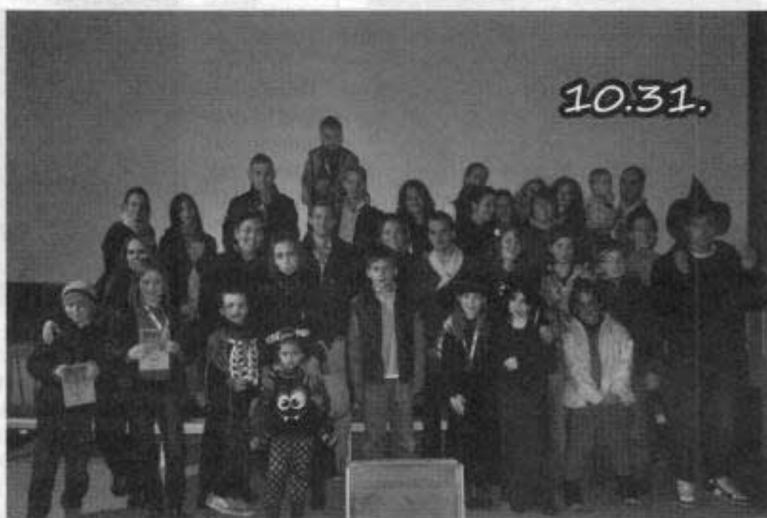
Harmadik alkalommal telt meg boszorkányokkal, szellemekkel és zombikkal a Maros Mozi. A halloweeni mulatság során több mint hatvan gyermek ismerkedett meg a tökfaragással vagy a lámpáskészítés nehézségeivel.