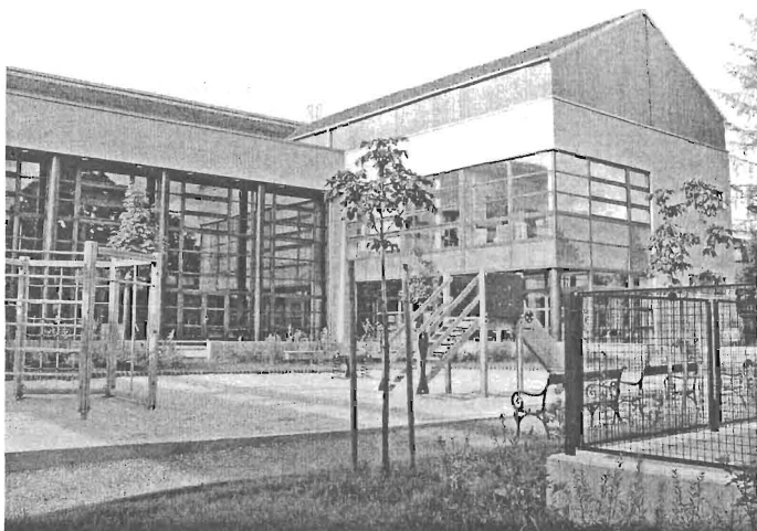
A Hősök terei iskola új épületszárnya az Önkormányzat eddigi legnagyobb beruházása

A költségvetés választókerületi keretéből minden évben lehetőségem nyílik a rákosligeti intézmények (az iskola, az óvodák, az idősek klubja és a művelődési ház) illetve a helyi egyesületek programjainak támogatására (a cserkészek nyári táboraitól országos falmászó versenyek megrendezésén át az idősek klubja autóbuzos kirándulásaiig), illetve környezetvédelmi és kulturális kezdeményezések (kiállítások, kiadványok, rendezvények) megvalósítására. Mint volt diákja, örömmel segítettem a Hősök terei iskola centenáriumi rendezvénysorozatának megvalósítását és az új iskolai könyvtár állományaának bővítését is.