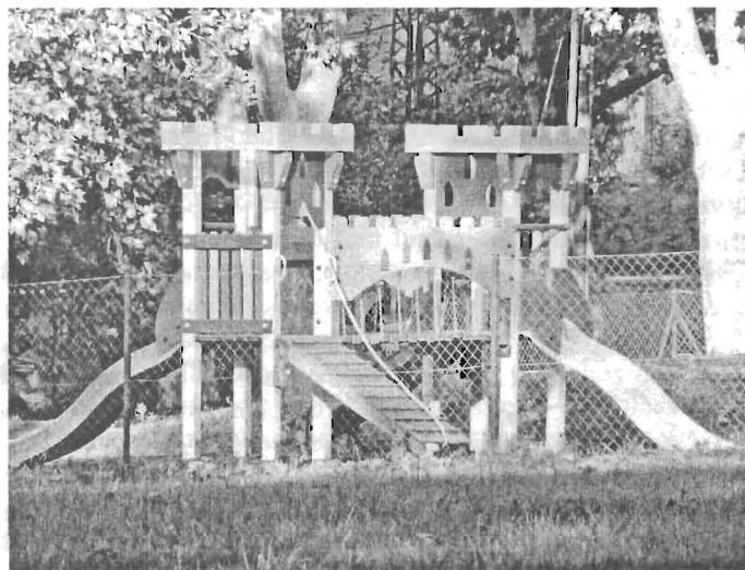
A napokban készült el a Heltai tér új játszótérea

– Az elmúlt években nagyon sokan voltak segítségemre abban, hogy közös céljainkat megvalósíthassuk – pedagógusok, mérnökök, művészek, orvosok, nyugdíjasok és fiatalok, sok-sok ligeti polgár. Az ő közösségi, közéleti tevékenységük elismerése érdekében kezdeményeztem 1999-ben, Rákosliget alapításának 100. évfordulója alkalmából, hogy az Önkormányzat a „Rákosligetért” Díj alapításával és adományozásával fejezze ki elismerését azon polgárok iránt, akik munkásságukkal, példamutatásukkal hozzájárultak városrészünk gyarapodásához, és kivívták a helybeli polgárok megbecsülését. A díjat minden esetben általam is nagyra becsült, a helyi közösség által ismert és tisztelt rákosligeti polgárok kapták.